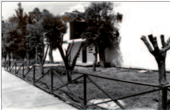
Pasillo y jardín frente al Departamento de Audiovisual